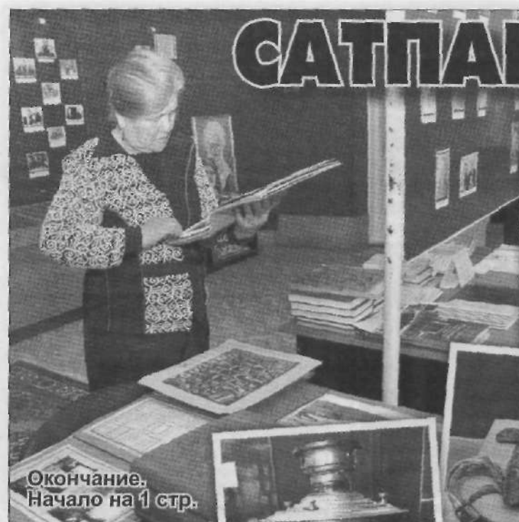
Окончание. Начало на 1 стр.